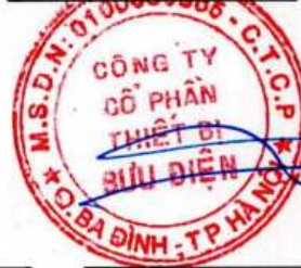
Trần Hải Vân Chủ tịch Hội đồng quản trị Hà Nội, ngày 03 tháng 03 năm 2025