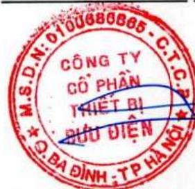
Trần Hải Vân Chủ tịch Hội đồng quản trị Hà Nội, ngày 03 tháng 03 năm 2025