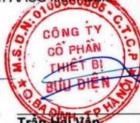
Trần Hải Vân Chủ tịch Hội đồng quản trị Hà Nội, ngày 03 tháng 03 năm 2025