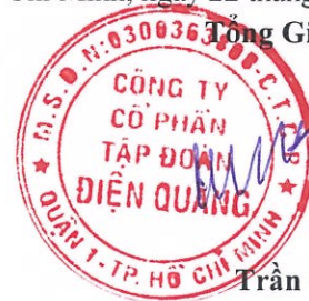
Trần Quốc Toàn