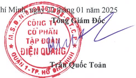
Trần Quốc Toàn