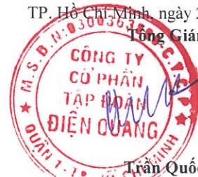
Trần Quốc Toàn