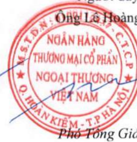
Phó Tổng Giám đốc