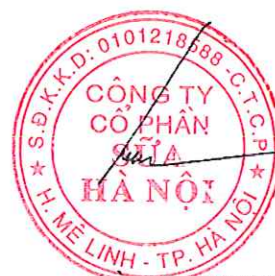
HÀ QUANG TUẤN