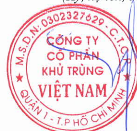
Trương Công Cứ