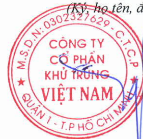
Trương Công Cứ