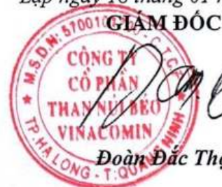
Đoàn Đức Thọ