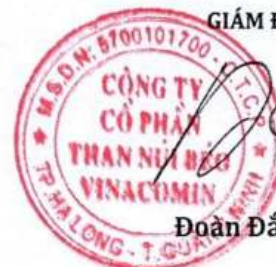
Đoàn Đắc Thọ