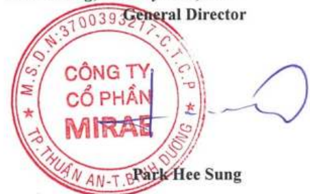
Park Hee Sung