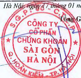
Nguyễn Chí Thành