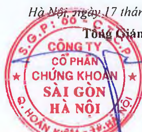
Nguyễn Chí Thành