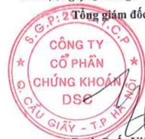
Bạch Quốc Vinh