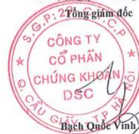
Bạch Quốc Vinh