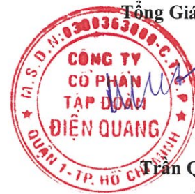
Trần Quốc Toàn