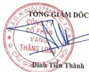
Đinh Tiến Thành