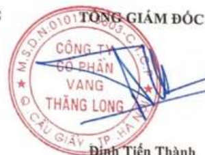
Đinh Tiến Thành