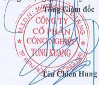
Lưu Chiên Hưng