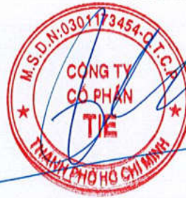
Trần Thế Vinh Chủ tịch Hội đồng quản trị