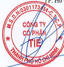
Trần Thế Vinh Chủ tịch Hội đồng quản trị