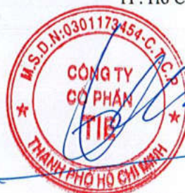
Trần Thế Vinh Chủ tịch Hội đồng quản trị