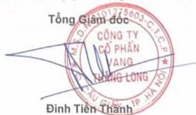
Đình Tiên Thành