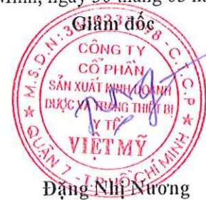
Đặng Nhật Nương