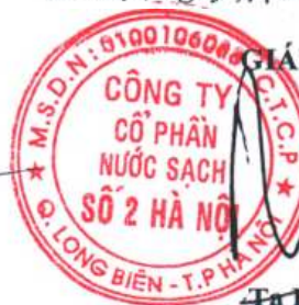
Tạ Kỳ Hưng