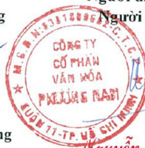
Phan Quốc Hưng