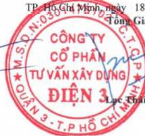
Lục Thái Phước