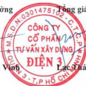
Lạc Thái Phước