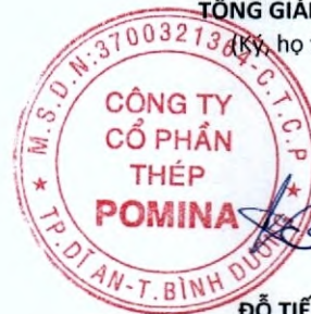
ĐỖ TIẾN SĨ