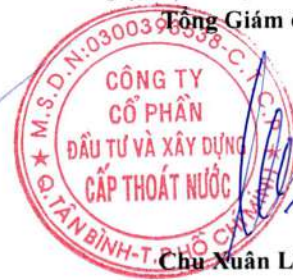
Chu Xuân Lãng