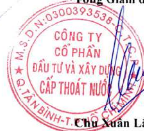
Chủ Xuân Lãng