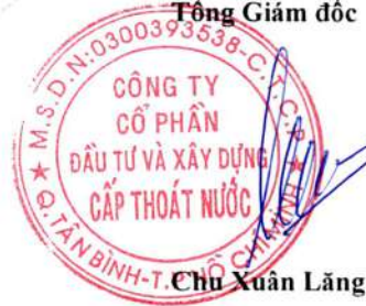
Chu Xuân Lãng