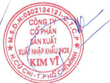
ĐỖ HÙNG Chủ tịch HĐQT