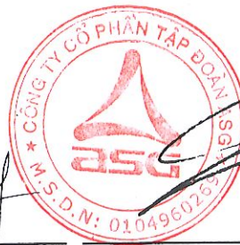
Dương Đức Tính Chủ tịch Hội đồng quản trị