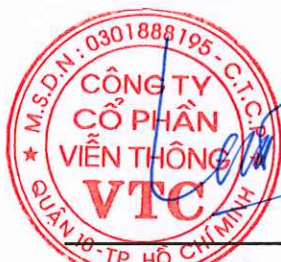
LÊ XUÂN TIẾN Chủ tịch Hội đồng Quản trị