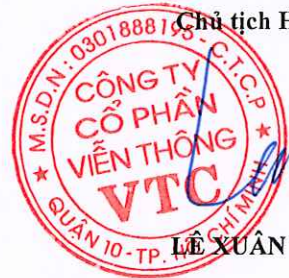
LÊ XUÂN TIẾN