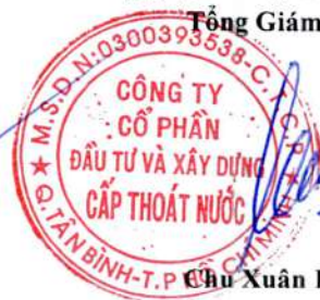
Chu Xuân Lãng