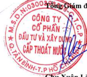
Chu Xuân Lãng