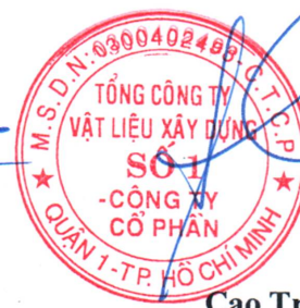
Cao Trường Thụ