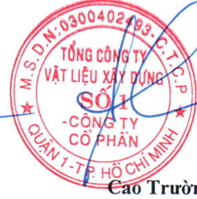
Cao Trường Thọ