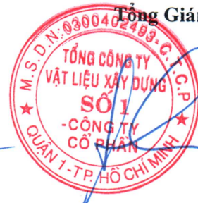
Cao Trường Thụ