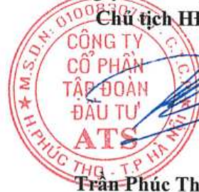
Trần Phúc Thiên Ân