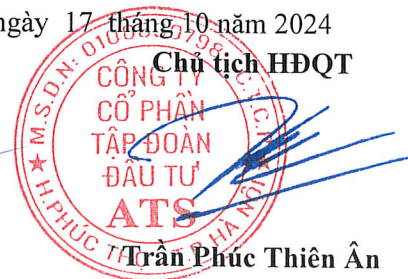
Trần Phúc Thiên Ân