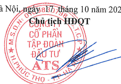
Trần Phúc Thiên Ân