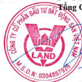
HỒ ĐẮC HÙNG