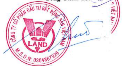
HỒ ĐẮC HUNG