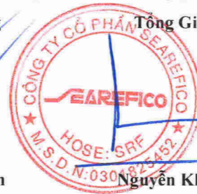
Nguyễn Khoa Đăng