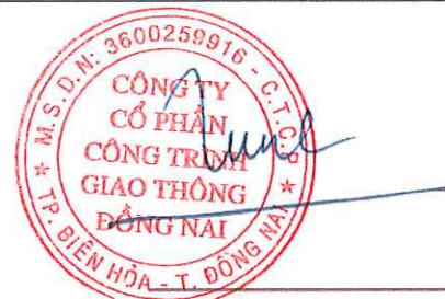
Tôn Đức Tùng