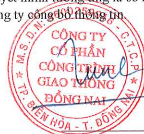
Tôn Đức Tùng