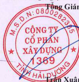
Trần Xuân Bản