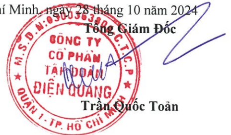
Trần Quốc Toàn