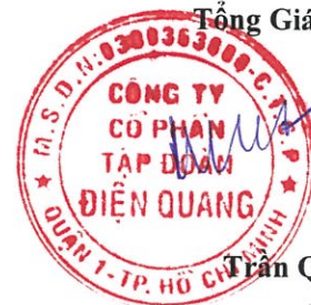
Trần Quốc Toàn