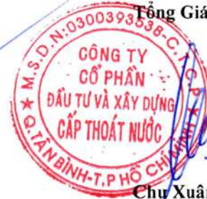
Chu Xuân Lãng