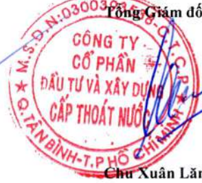
Chu Xuân Lãng