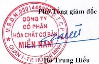
Đỗ Trung Hiếu