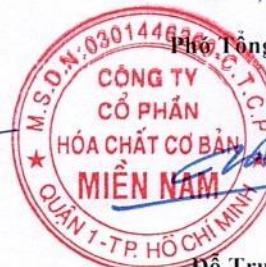
Đỗ Trung Hiếu