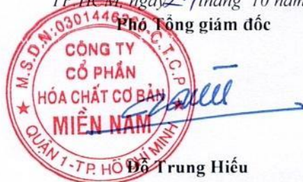
Đỗ Trung Hiếu