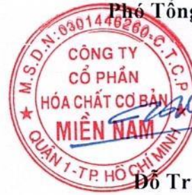
Đỗ Trung Hiếu