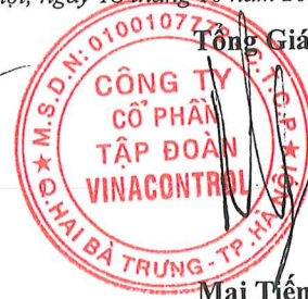
Mai Tiến Dũng