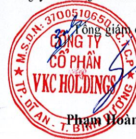
Võ Xuân An