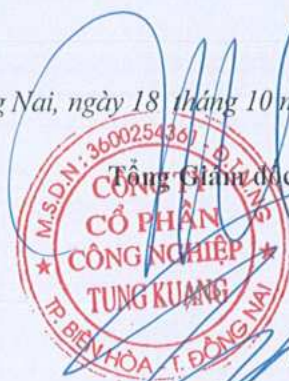
Lưu Chiến Hưng