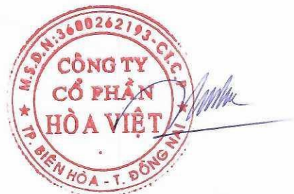
Lương Hữu Hưng