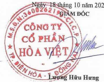
Lương Hữu Hưng