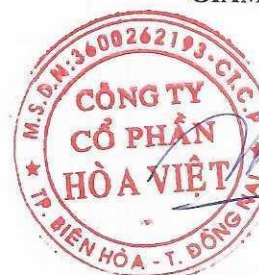
Lương Hữu Hưng