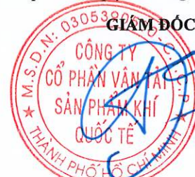
Đoàn Đức Trọng