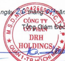
Ngô Đức Sơn