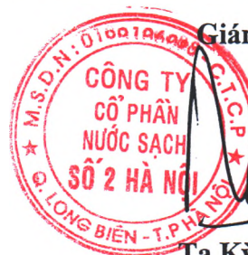
Tạ Kỳ Hưng