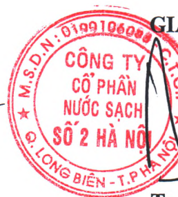
Tạ Kỳ Hưng