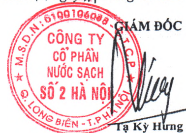
Tạ Kỳ Hưng