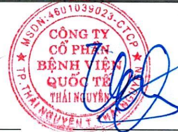
Hoàng Tuyên Chủ tịch Hội đồng Quản trị