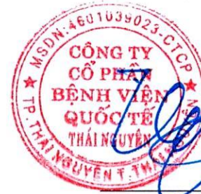
Hoàng Tuyên Chủ tịch Hội đồng Quản trị Ngày 25 tháng 4 năm 2024