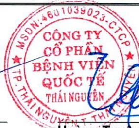
Hoàng Tuyên Chủ tịch Hội đồng Quản trị