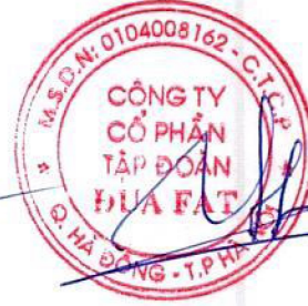
Lê Duy Hưng

Lập ngày 30 tháng 07 năm 2024 Chủ tịch Hội đồng quản trị