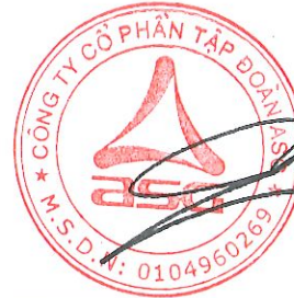
Dương Đức Tính Chủ tịch Hội đồng quản trị