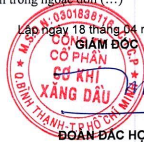
ĐOÀN ĐẶC HỌC