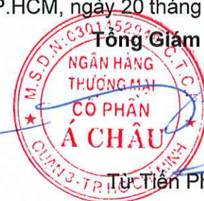
Từ Tiên Phát