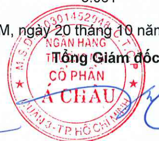
Từ Tiến Phát