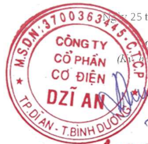
Trương Trúc Quyên