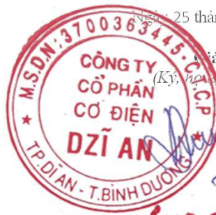
Trương Trúc Quyên