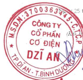
Trương Trúc Quyên