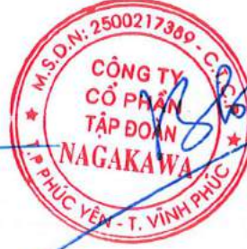
Trương Bình Dương