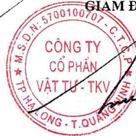
HOÀNG XUÂN TÙNG