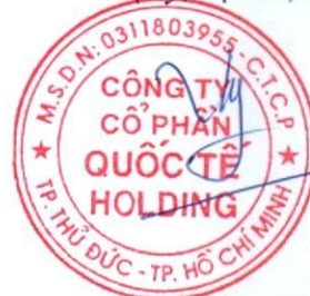
Đặng Thúy Vy