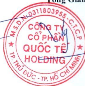
Đặng Thúy Vy