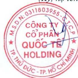
Đặng Thúy Vy