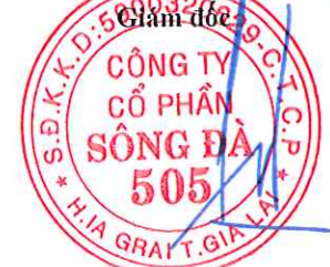
Đặng Tất Thành