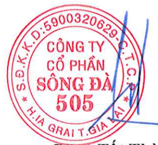
Đặng Tất Thành