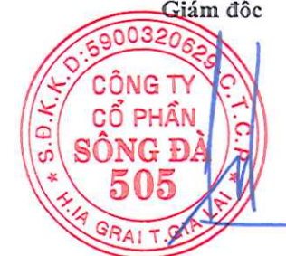
Đặng Tất Thành